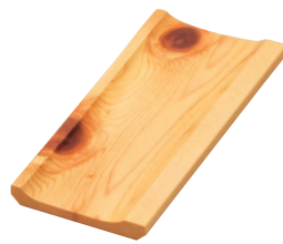
ひのき紅節オシボリ皿