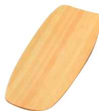
ひのきオシボリ皿(舟型)