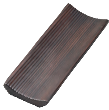
焼杉・スリムおしぼり受け