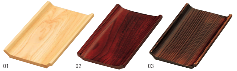
ワイドおしぼり皿 (4~5人用)